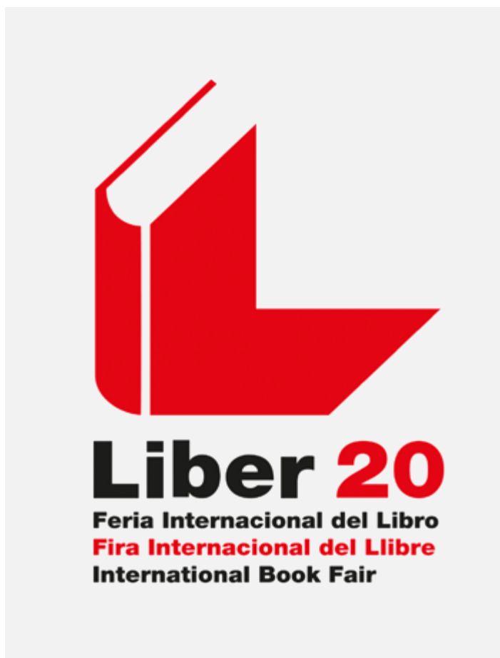
Logotipo oficial de la Feria Internacional del Libro 2020.