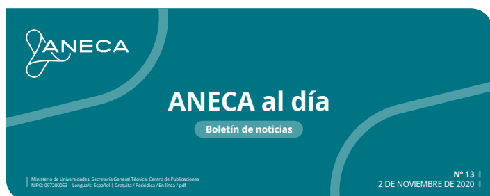
Cabecera del boletín digital Aneca al día.

El boletín quincenal de ANECA, en su primer año de edición, ha sido seleccionado como publicación administrativa en la Feria Internacional del Libro Barcelona (LIBER).