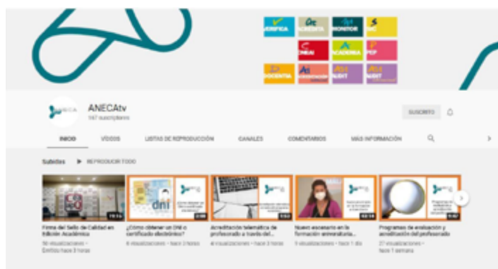
ANECAtv, el canal de Youtube de la Agencia.