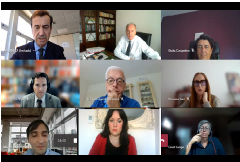
Instante de la sesión celebrada virtualmente entre ANECA y FEANI.

La propuesta de la Agencia consiste en una aproximación a las ingenierías en Europa que haga frente a los problemas complejos que plantea la sostenibilidad, mediante el desarrollo de un conjunto de indicadores cuantitativos y cualitativos que permitan la detección, implantación y seguimiento de las competencias verdes, digitales, de emprendimiento y de resiliencia que debe alcanzar la nueva generación de ingenieras e ingenieros, personas comprometidas socialmente.