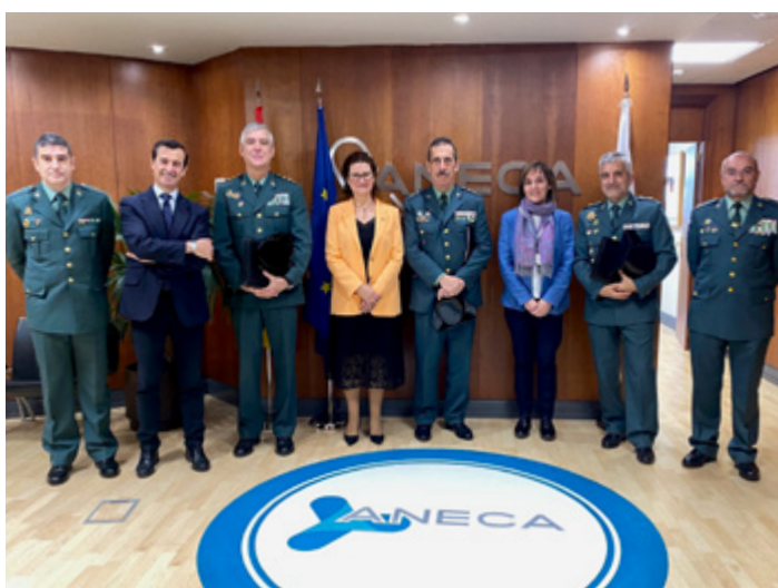
Fotografía de la reunión entre ANECA y la Dirección General de la Guardia Civil, celebrada en la sede de la Agencia.