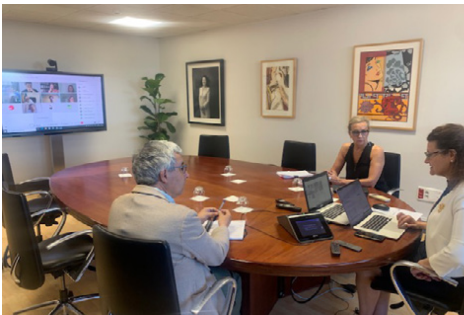
Imagen de archivo del Consejo Rector de ANECA (26 de julio de 2022).

Por otro lado, aseguró que “una de nuestras misiones es la promoción de las universidades y de la Educación Superior, la europeización de nuestras universidades, así como su transformación digital”. En este sentido, ANECA ha respaldado diversos proyectos y grados europeos conjuntos liderados por universidades españolas.