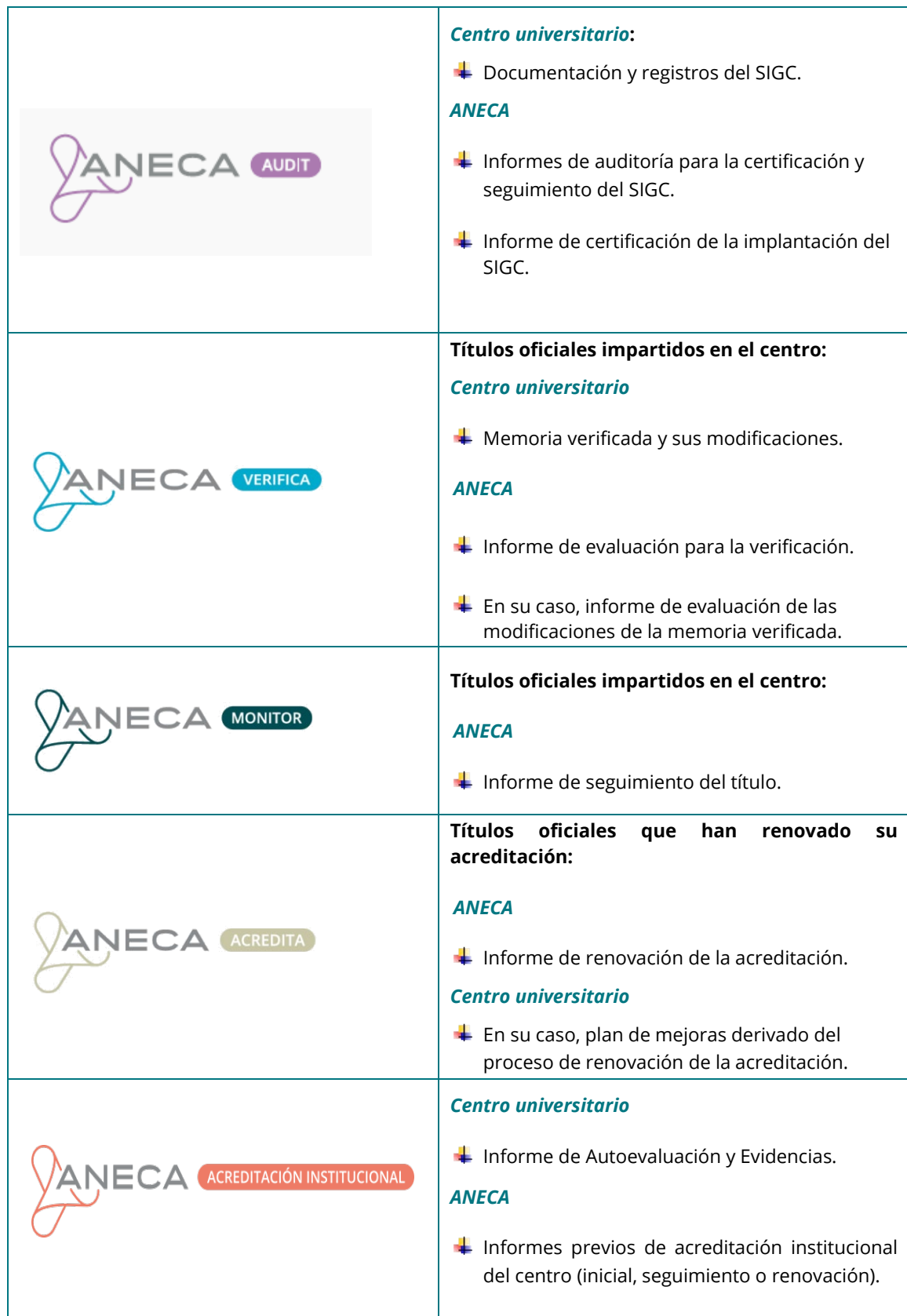
Tabla 5. Documentación de los diferentes programas de evaluación y certificación de ANECA que formará parte del dossier de acreditación institucional del centro universitario.