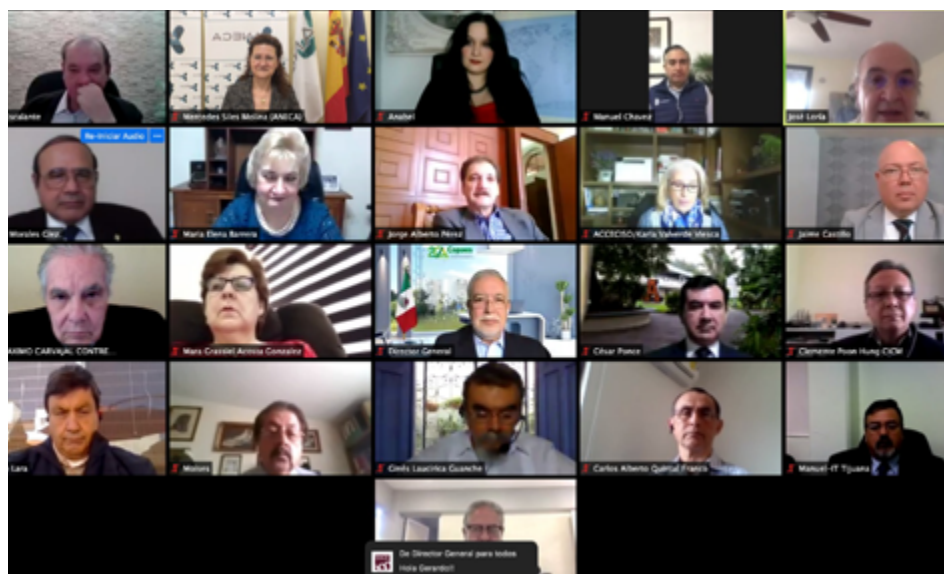
Representantes de ANECA y CACEI en un momento de la reunión virtual.

La Agencia Nacional de Evaluación de la Calidad y Acreditación y el Consejo de Acreditación de la Enseñanza de la Ingeniería, A.C. (CACEI) han renovado su acuerdo de cooperación para ofrecer el certificado del sello EURACE que permite a los programas mexicanos de Ingeniería aprobados por el CACEI contar con el reconocimiento de un sello de calidad internacional, a través de ANECA, que es el órgano español reconocido por la European Network for the Accreditation of Engineering Education ( ENAE ) para la evaluación de títulos de Ingeniería que opten a este reconocimiento europeo.