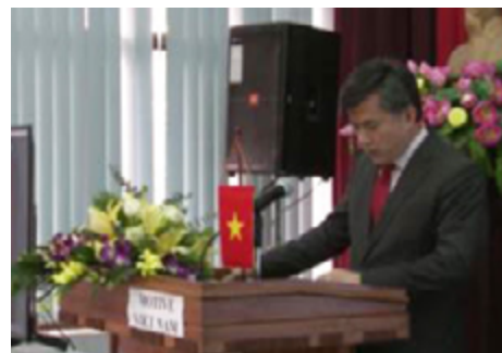
Posts and Telecommunications Institute of Technology de Hanoi (Vietnam).

El encuentro contó con la asistencia presencial de los socios vietnamitas y la asistencia virtual del coordinador, AlmaLaurea, junto con los representantes de los organismos e instituciones europeas: Agencia Nacional de Evaluación de la Calidad y Acreditación (ANECA), la Universidad de Ciencias Aplicadas Joanneum (Austria), la Universidad de Barcelona y el International Consulting and Mobility Agency (INCOMA).