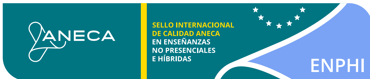
Imagen del SIC ANECA en Enseñanzas no Presenciales e Híbridas