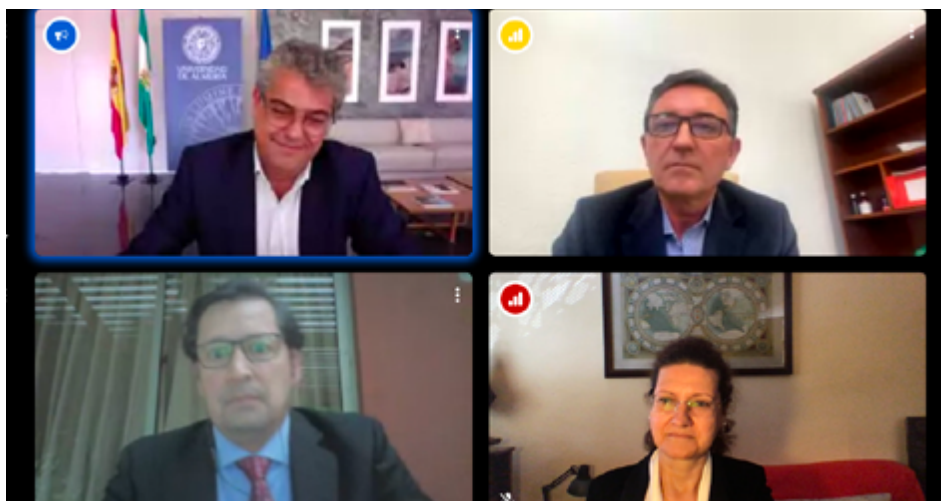
Imagen de la inauguración telemática de CIDICO2020.