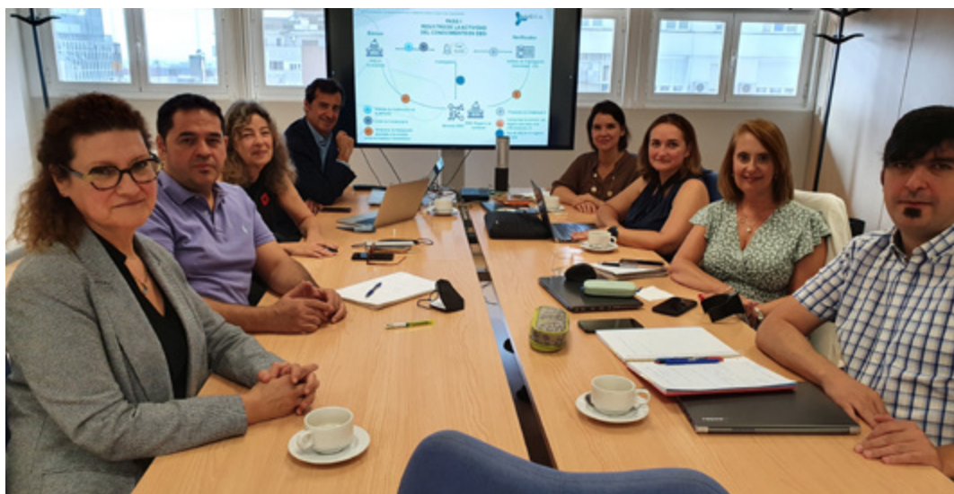
Imagen de la reunión entre los equipos de la Agencia de Calidad y Aseguramiento de la Calidad y la Fundación Española para la Ciencia y la Tecnología, celebrada el 5 de octubre.

En la reunión se trasladó una perspectiva compartida sobre el avance del CVN en forma de hitos y compromisos que se resume en la certificación CVN del programa Academia de ANECA en exportación. Se realizará en una primera fase antes de que con-