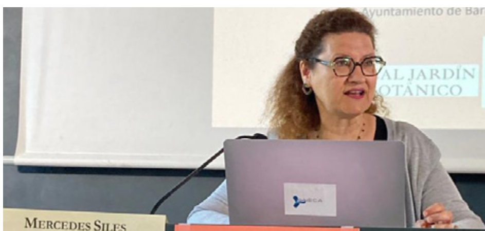
Instante de la intervención de la directora de ANECA en la XXI Asamblea General de la Asociación de Mujeres Investigadoras y Tecnólogas.

La directora de ANECA explicó que actualmente se debate sobre el valor de lo cualitativo y de lo cuantitativo y recordó que ANECA, que se ha sumado al manifiesto de Leiden, considera que se deben tener en