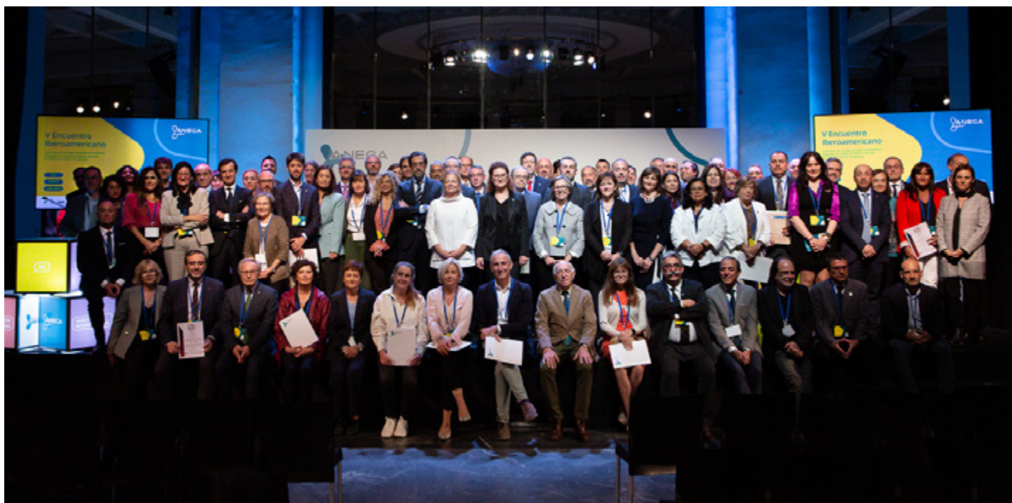
Foto de grupo V Encuentro Iberoamericano.

Desde las 10:30 de la mañana del pasado 11 de octubre, más de 200 personas se fueron acreditando como representantes de universidades, instituciones, asociaciones internacionales, gestoras del aseguramiento de la calidad, evaluadoras, evaluadores y profesionales, para asistir a la ceremonia de entrega de los Reconocimientos Integrales de Calidad de ANECA y del Sello de Calidad en Edición Académica, en el marco del V Encuentro Iberoamericano. Un encuentro en el que, además de otorgar reconocimiento a las instituciones distinguidas con los sellos de calidad, ha permitido reflexionar sobre su relevancia para la mejora del sistema académico, científico y profesional.