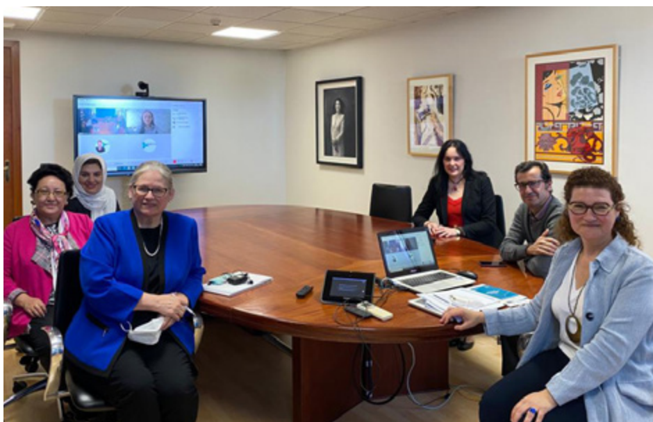
Reunión para el seguimiento de la convocatoria piloto del SIC de Medicina.

El sello WFME es un marchio de calidad para las titulaciones que lo tengan, y permitirá a sus egresadas y egresados ejercer la profesión también en Estados Unidos.