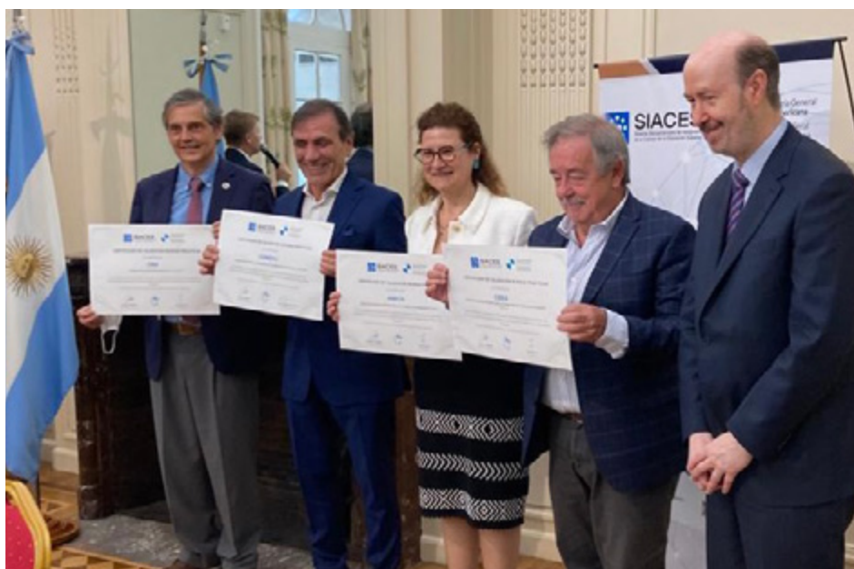
Momento de la entrega de los diplomas de validación de buenas prácticas.