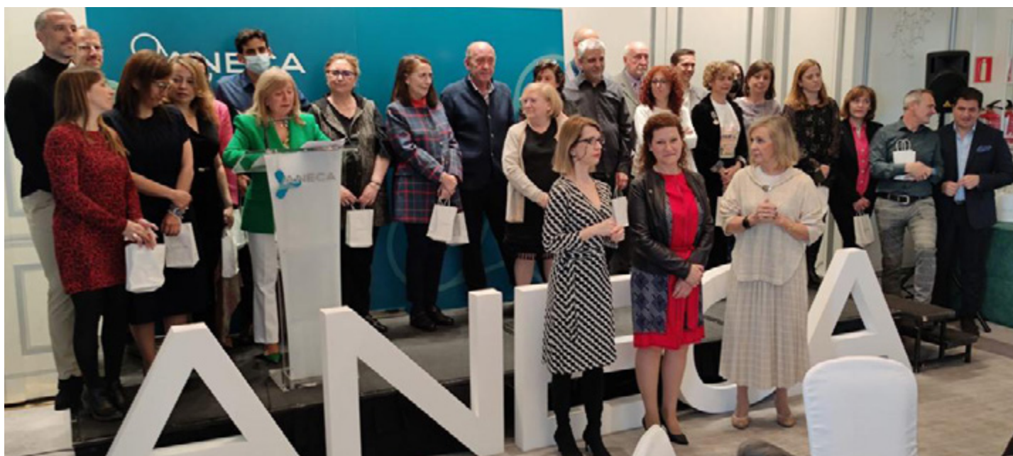
Foto de la celebración del homenaje a las 39 personas que llevan más de 15 años trabajando en la Agencia.

ANECA ha celebrado el 27 de abril un emotivo homenaje a las 39 personas que llevan más de quince años trabajando en la Agencia cuando se cumple en 2022 el 20 aniversario de las primeras incorporaciones de personal a la Agencia. El evento ha sido, en palabras de la directora, Mercedes Siles Molina, una acción más para construir ANECA con lazos de afecto.