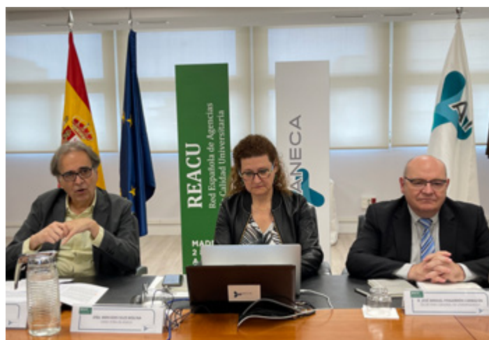
Joan Subirats Humet, Ministro de universidades; Mercedes Siles Molina, directora de ANECA y José Manuel Pingarrón Carrazón, Secretario de General de Universidades.

Siles Molina ha asegurado que “las alianzas de universidades europeas, los títulos europeos y las microcredenciales son esenciales”. En este sentido ANECA