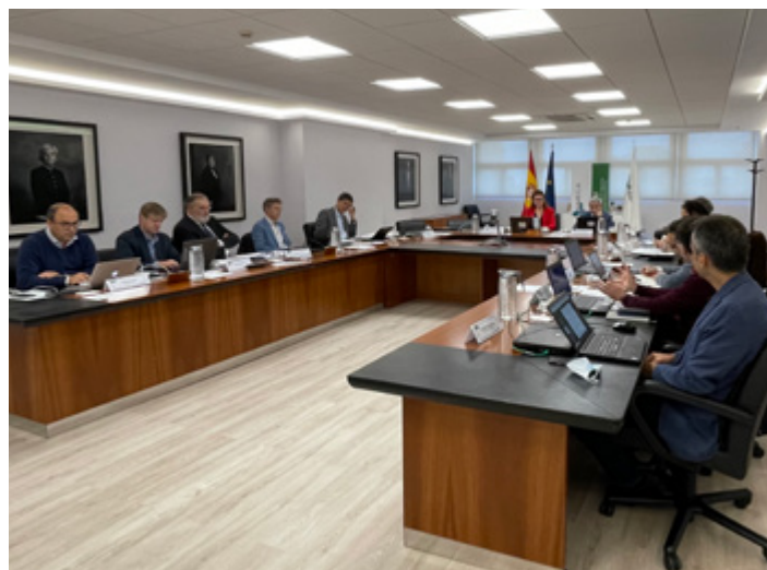
Mesa del encuentro de la Red Española de Agencias de Calidad Universitaria (REACU), celebrado en la sede de ANECA en Madrid.

La jornada inaugural del día 28 ha contado con la participación del ministro de Universidades, quien ha compartido su visión sobre la Ley Orgánica del Sistema Universitario (LOSU) y ha escuchado, a su vez, los planteamientos que desde el aseguramiento de la calidad vienen realizando las agencias. Ministerio y REACU han coincidido en seguir avanzando en el modelo de corresponsabilidad, en el que administraciones, agencias y universidades comparten la gestión y garantía de la calidad, contribuyendo a reforzar la confianza de la sociedad en las universidades. Las agencias de calidad universitaria también han abordado el papel clave de los resultados de aprendizaje para la configuración de los programas formativos universitarios que tengan como centro al estudiantado, y cómo desde las agencias se puede promover y asegurar su calidad. Uno de los temas destacados ha sido la calidad de la docencia y la configuración de un marco de desarrollo profesional docente del profesorado en cada universidad, como referente de calidad y horizonte de mejora continua de los procesos de enseñanzas y aprendizaje, vinculado a los planes de formación del profesorado, el reconocimiento de la calidad y la excelencia docentes y cuantas consecuencias se contemplen en el modelo de evaluación de la actividad docente establecido por cada institución.