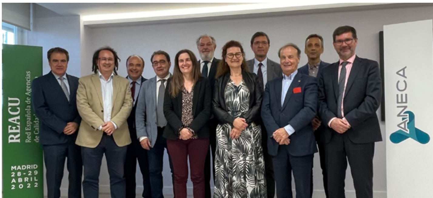
Red Española de Agencias de Calidad Universitaria (REACU).