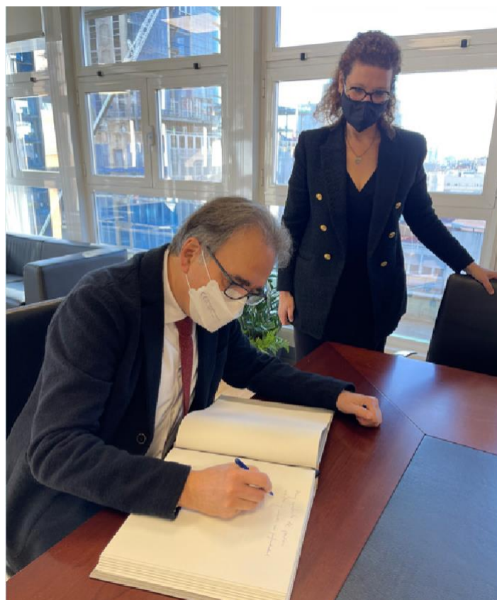
Joan Subirats firma en el libro de honor de la Agencia.