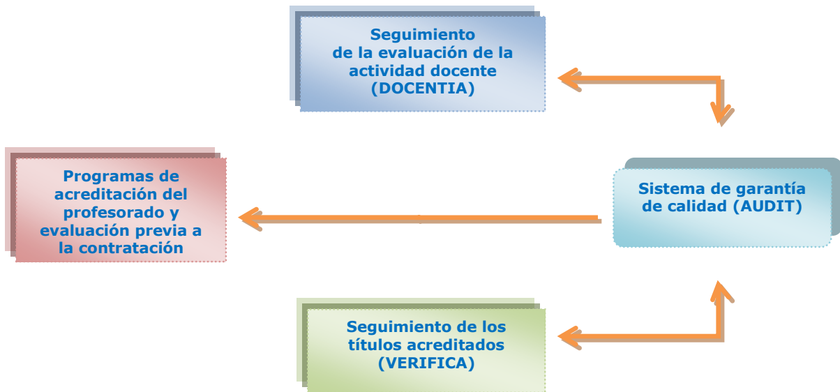
Figura 1: Retroalimentación entre AUDIT, DOCENTIA y VERIFICA

En consecuencia, el seguimiento de la evaluación de la actividad docente del profesorado aporta información necesaria para el seguimiento de los títulos acreditados que se imparten en esa universidad.